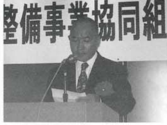
安芸地区 衛生施設管理組合 立島事務局長