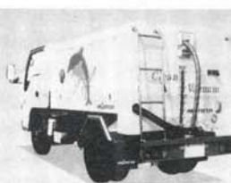
エコパネル付バキュームカー