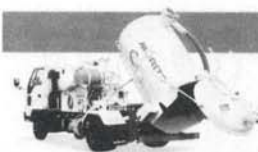
パワフルマスター(強力吸引車)