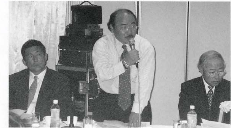
説明する黒瀬副理事長