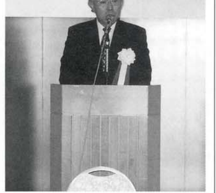
三井理事長 あいさつ